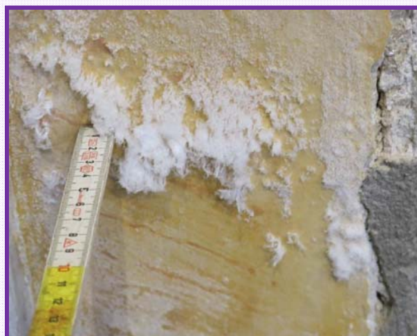
ZOCCO PERIMETRO INTERNO: risanamento murature e restauro conservativo delle superfici